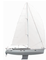
BAVARIA CRUISER 51 Page 40